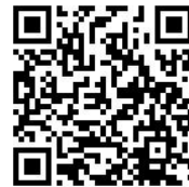
共識營報名 QR CODE